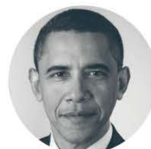
BARACK OBAMA (1961 -) © 2008 Pete Souza