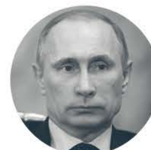
VLADIMIR POUTINE (1952 -)