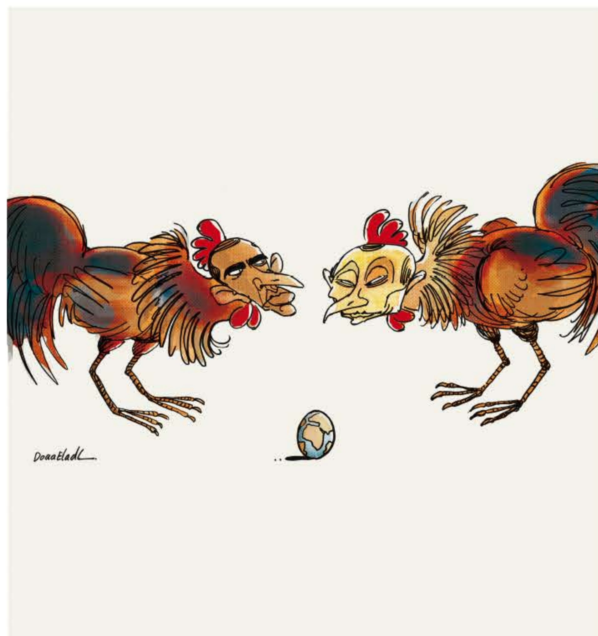
Doaa Eladl - Egypte (2013)