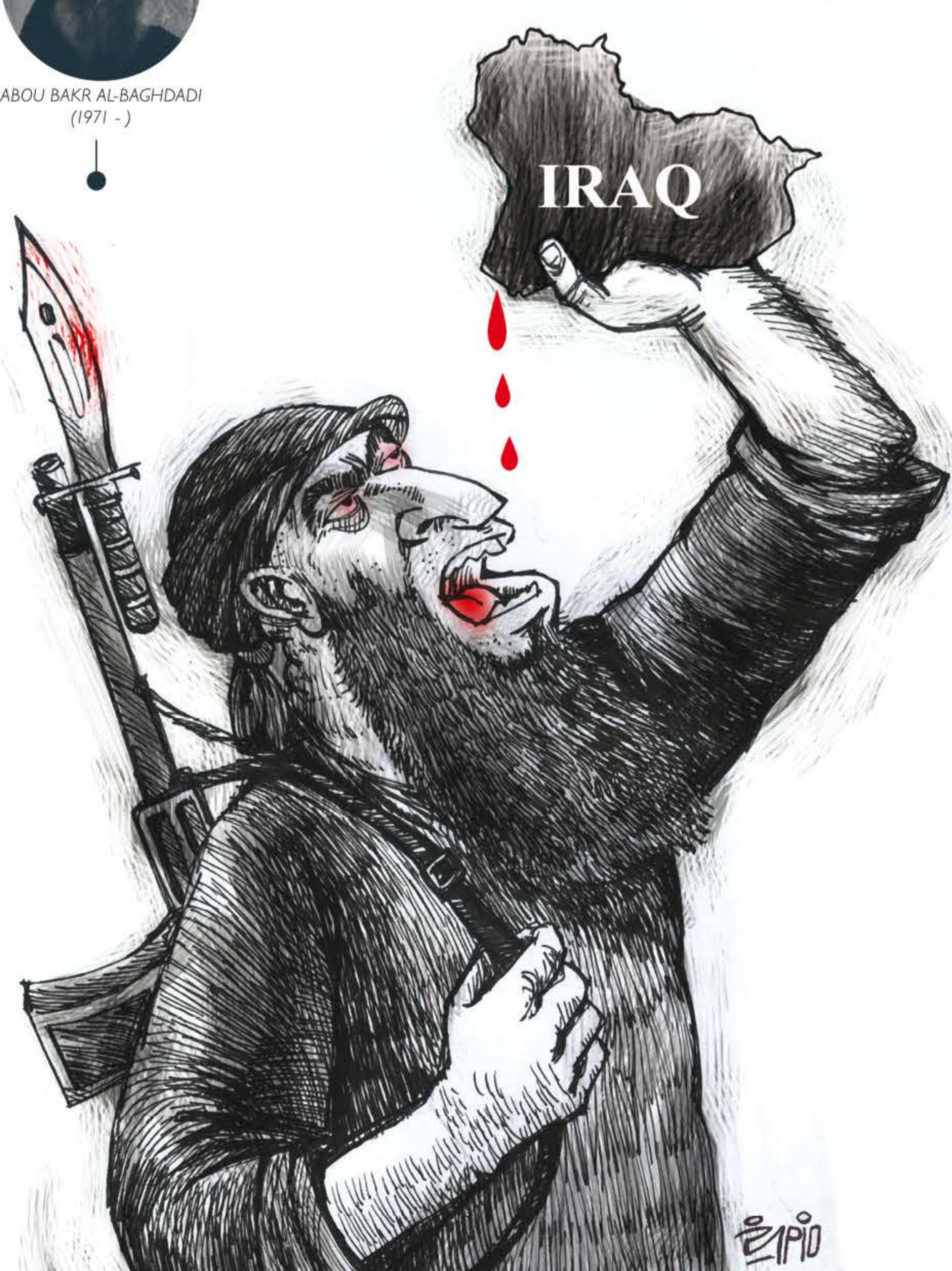
Firoozeh - Iran (2014)