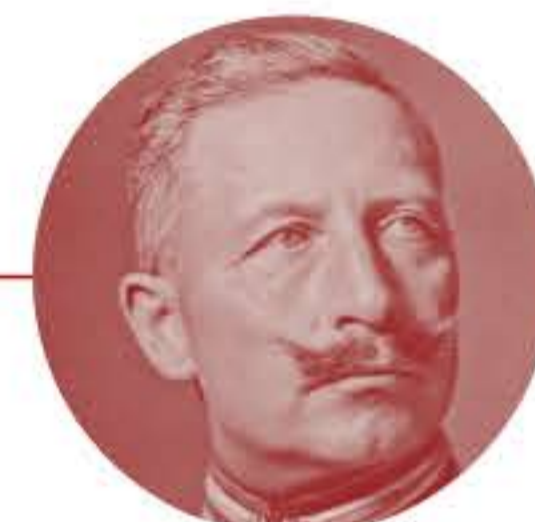
GUILLAUME II (1859-1941)