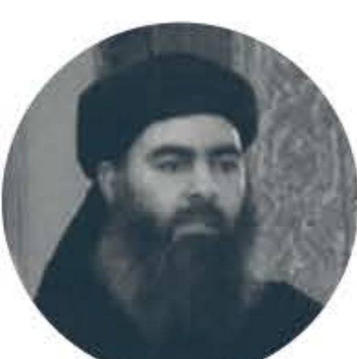
ABOU BAKR AL-BAGHDADI (1971 -)