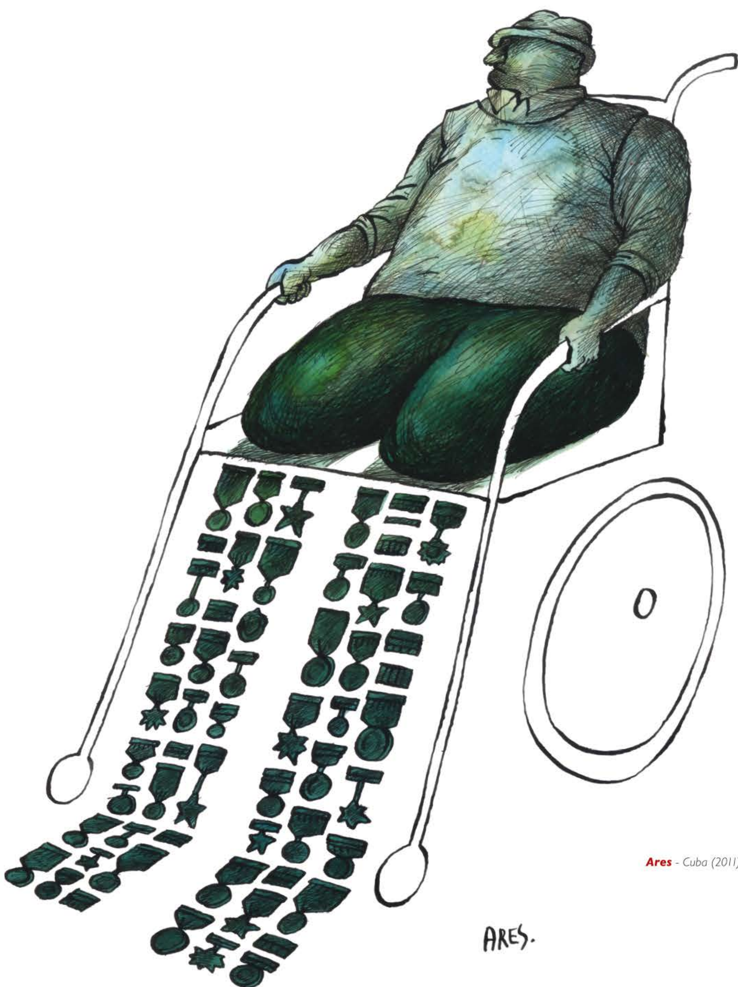
Ares - Cuba (2011)