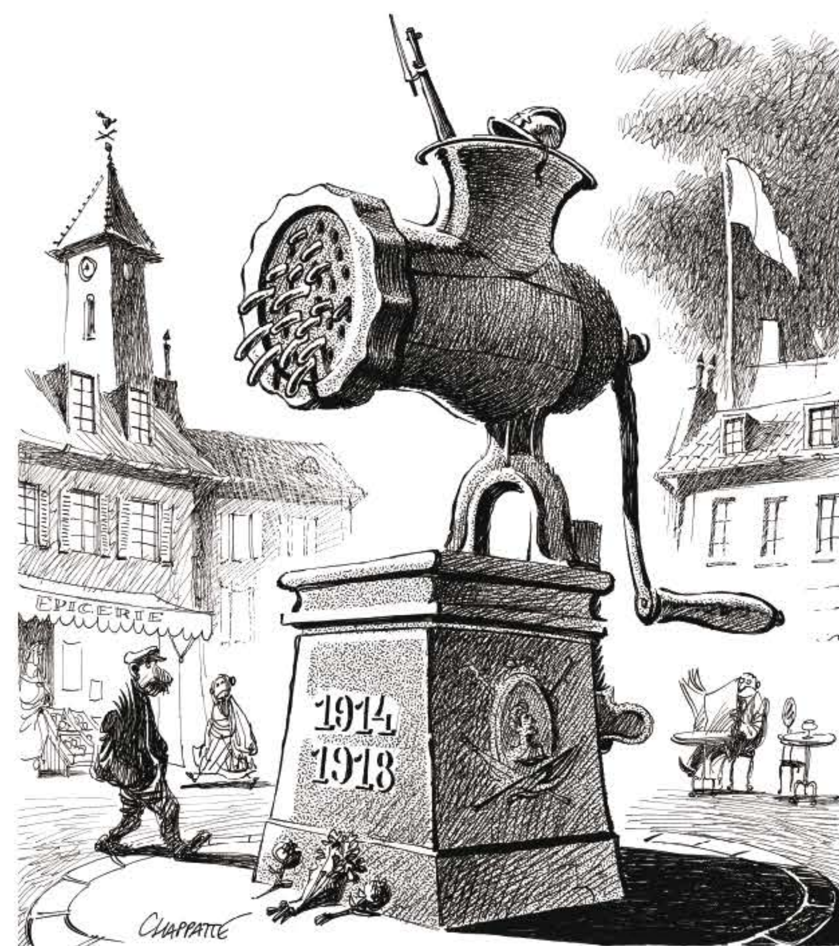
Chappatte - Suisse (2003)