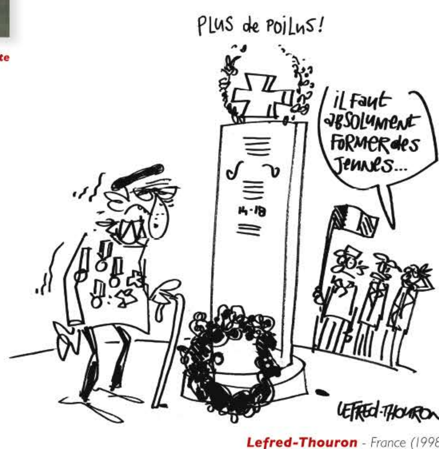
Lefred-Thouren - France (1998)